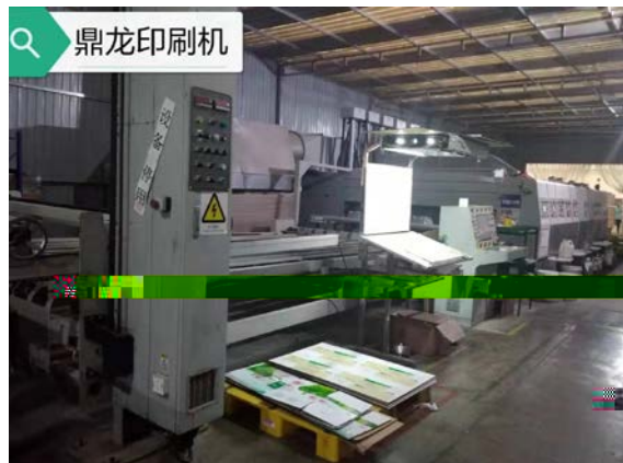
. 4-1 g j