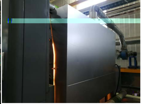
. 4-5 g jLÖ"D5™