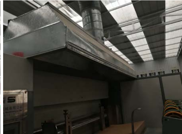
. 4-3 gj: éLö"D5™