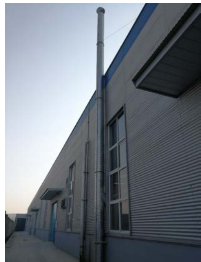
. 7 15m Â"D1,