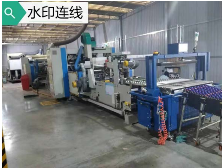
. 4-2 gj