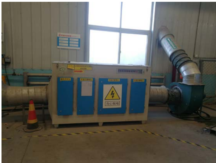
. 6 y"W Ü F>65ž